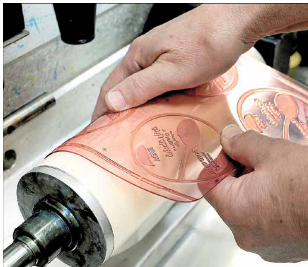
Der findes forskellige typer af trykklischeer - denne er af gummi.