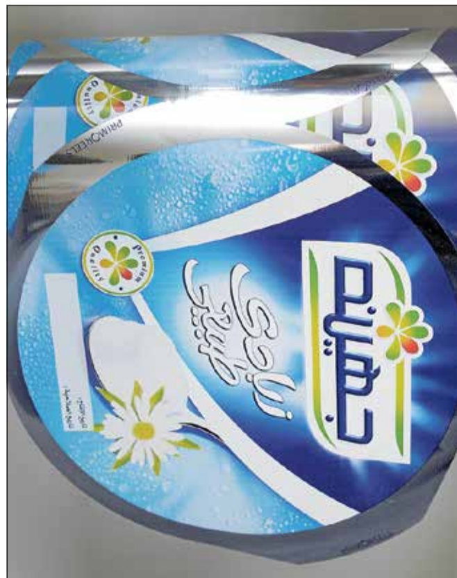
Et eksempel på et af Primoreels plastfolielæg til det mellemstørste marked.